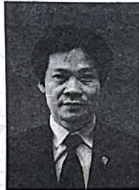
Given under the Seal of the State Council for Professorship

for having met the standards of associate professor title in: Economics