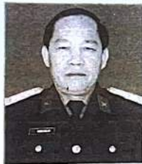
Given under the Seal of the State Council for Professor Title